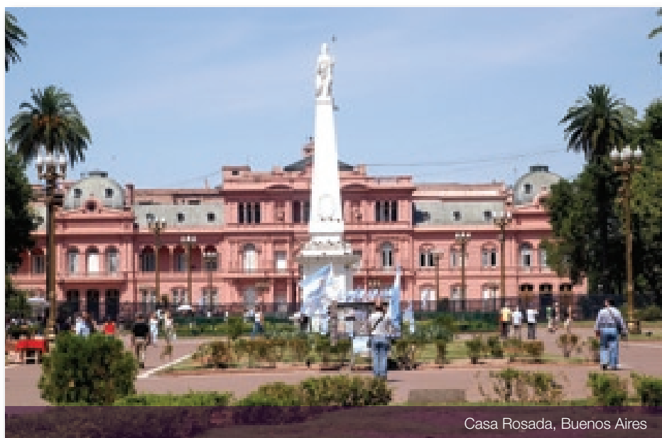
Casa Rosada, Buenos Aires

En avant midi, tour de ville de Buenos Aires, capitale du Tango et des « asados » ou grillades de bœuf argentin. Vous verrez le Centro, cœur de la ville, avec ses parcs, ses immeubles et ses élégantes avenues truffées de boutiques, dont la fameuse calle Florida et l'Avenue du 9 juillet, la plus large du monde... Vous découvrirez le quartier culturel ainsi que le Théâtre Colon, siège de l'opéra de Buenos Aires, reconnu notamment pour l'opulence de son architecture européenne et la qualité